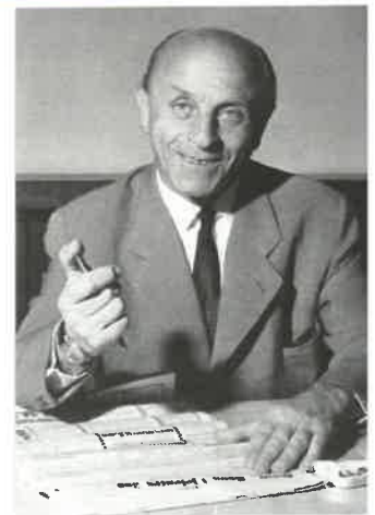
Bíró László József a golyóstoll feltalálója

közül néhány számunkra érdekeset választottunk ki. Ilyen volt többek között: az ablaktörő, a Ford-T modell, a gyufa, a Béres csepp, a színes televízió, a golyóstoll és a mai adidas cipő története. Érdekességképpen pedig olyan találmányokról is