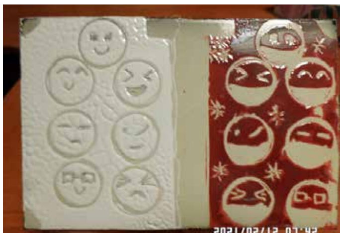
Bodnár Árpádné A épület