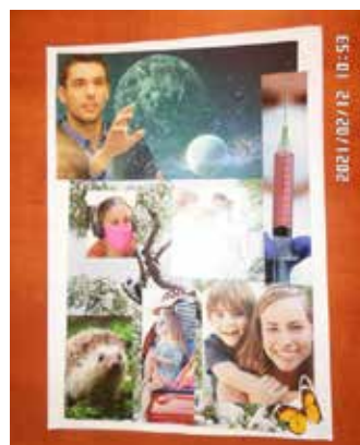
2 emelt közös munka

ben dolgozóknak és az ott élőknek egyaránt. Mégis az intézményekben járva azt tapasztalta, hogy minden kihívás ellenére megvan az a fajta összetartás, összekapaszkodás és bátorság, ami a mostani túléléshez szük-