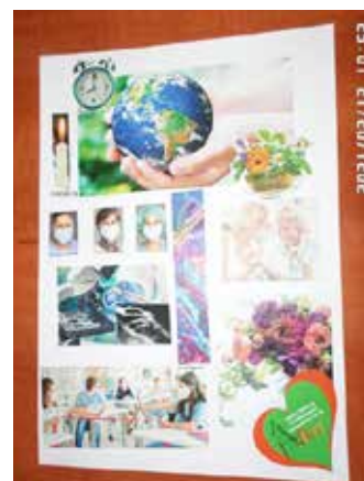
Berbuch Miklósné A épület