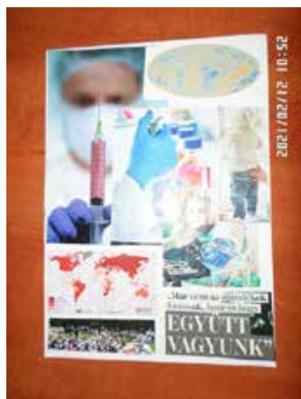
Józan Jánosné A épület