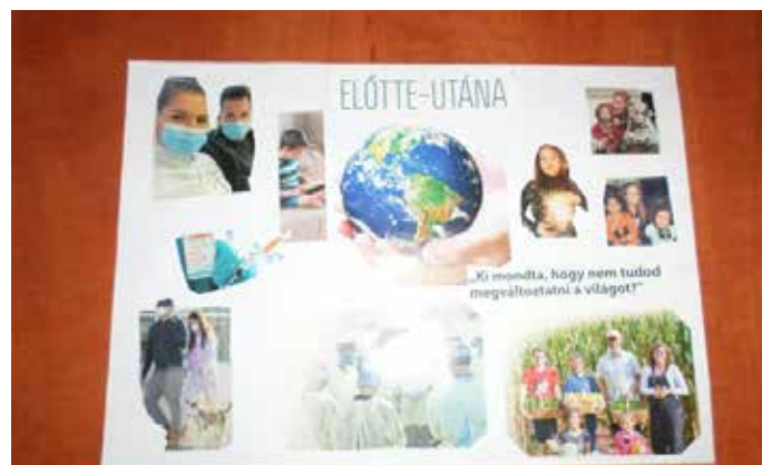
Szabó Józsefné A épület

séges. „Annak a megtetszésülése, hogy együtt minden nehézséget le tudunk győzni, de csak együtt sikerülhet mindezen úrrá lenni” - mondta.