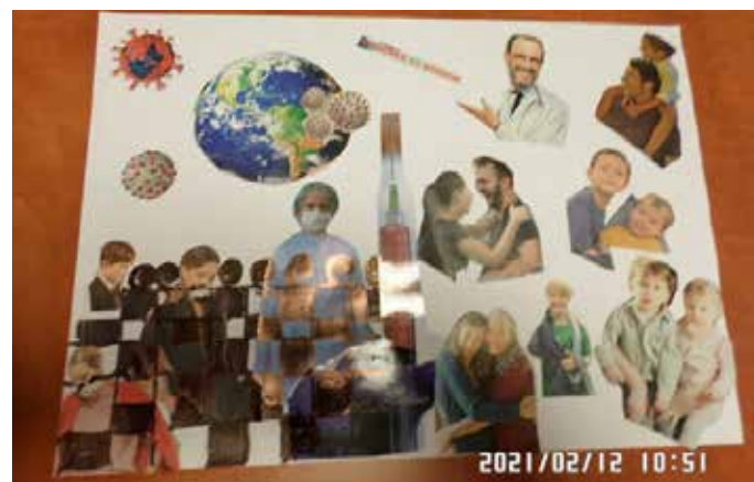
Bodnár Árpádné A épület